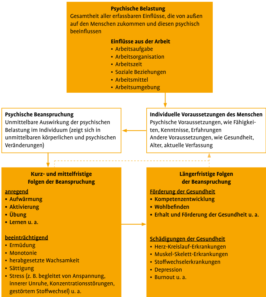
Abbildung 1: Psychische Belastung, Beanspruchung und Beanspruchungsfolgen